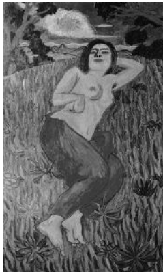
『裸体美人』 油彩・画布 1912(明治 45)年 162.0×97.0cm 東京国立近代美術館蔵 〔重要文化財〕