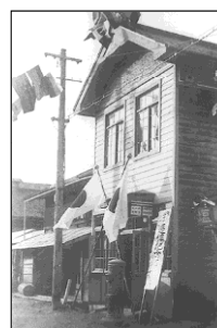
萬の土沢のアトリエ (写真は後に郵便局と していた頃のもの)

1914(大正3)年9月、生活と制作上の理由から、家族と共に郷里土沢に帰る。一年半の土沢での滞在の間、萬は本家「八丁」と街道を挟んで筋向いにあった。倉庫を改造し、父の家族とは別に住む。ここに隣接したモダンな木造西洋館にアトリエを構える一方、電灯会社の代理店も営むが、店はほとんどよ志夫人にまかせ制作に専念する。