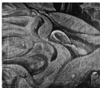
『丘のみち』 油彩・画布 1917(大正 6) 年頃 162.5×112.5cm 萬鉄五郎記念美術館蔵

自画像と故郷の風景が、郷里土沢での制作テーマ。特に自画像は一作ごとに形態の解体がすすみ、この作品に至っては内面に潜む形、内なる「顔」を描き出したと見ることもできる。