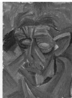
左／『自画像』 油彩・画布 大正 45.8×33.5cm 岩手県立美術館蔵