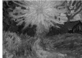
『太陽と道』 油彩・板 1912 年頃 24.0×33.0cm 萬鉄五郎記念美術館蔵