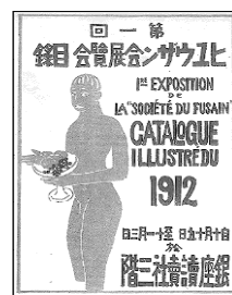
第1回フウザン会 展目録

1912(明治45・大正元)年、美術学校を卒業した萬は、フォーヴィスム(野獸派)や表現主義など新しい表現を積極的に試みる。また、同年9月に結成されたフウザン会に参加。同会は、 さいとうより 斎藤与里、 きしだりゆうせい 岸田劉生、高村光太郎らが発起人となり作られた美術家集団。2回の展覧会を開いたのみで翌年5月解散した。活動期間は短い、日本で初めての表現主義的な美術運動として、先駆的な意義を持つ。参加者は他に萬鉄五郎、 きむらしやうはち 木村莊八、バーナード・リーチなど。若い芸術家30人余が参加し、ゴッホ、ゴーギャン、セザンヌ、マチスなど、後期印象派やフォービズムの影響が強くみられる。