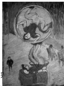
『軽業師』 油彩・板 1912 年頃 24.0×33.0cm 萬鉄五郎記念美術館蔵