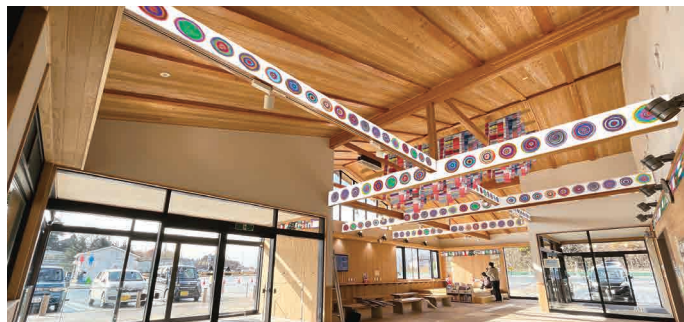
トイレ休憩施設・装飾のイメージ