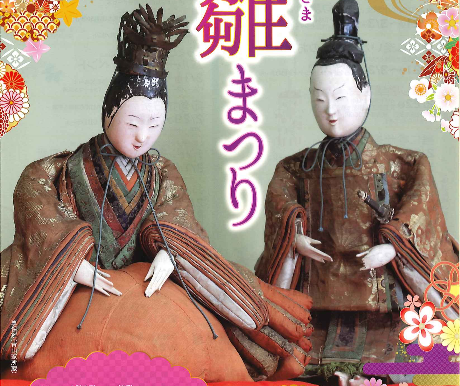
享保雛(青山家所蔵)